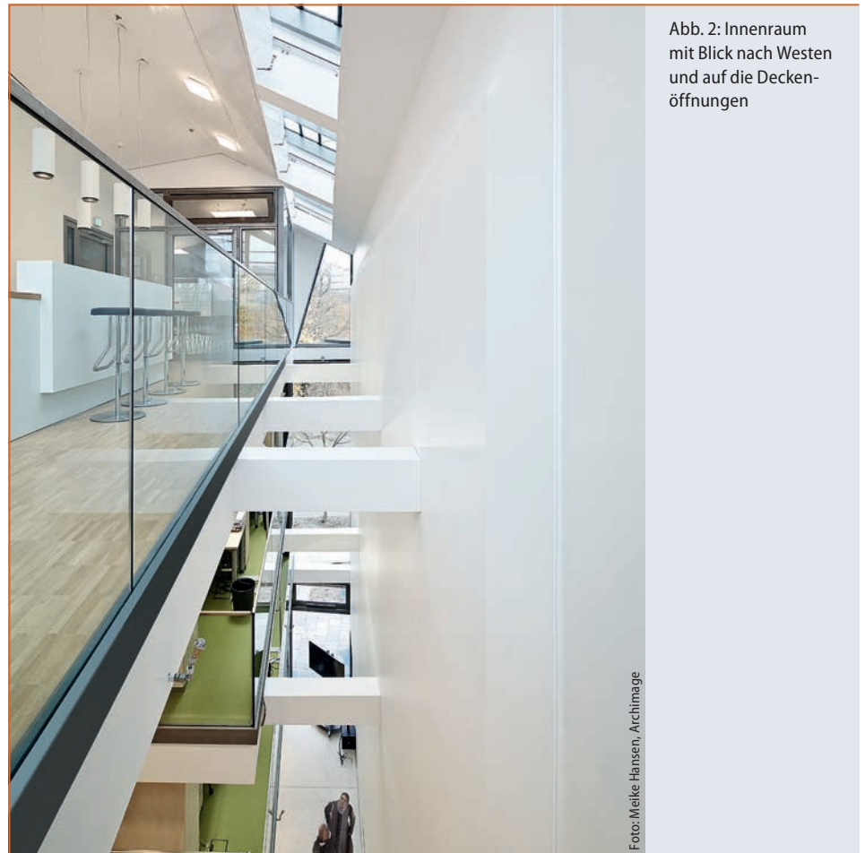
Abb. 2: Innenraum mit Blick nach Westen und auf die Deckenöffnungen

So sah der ursprüngliche Ansatz ein Gebäude mit Tragwerk und Decken aus Holz vor, gleichsam die fortgesetzte Bauweise des Bestandsgebäudes. Zur Entlastung der Bauteile wurde der Feuerwiderstand auf 30 Minuten festgesetzt. Bereits bei dieser Variante war eine automatische Löschanlage fester Bestandteil der Gebäudeausrüstung, hier mit einer Wirkzeit von 90 Minuten. Schon dieser Ansatz machte die Beengtheit des Gebäudes deutlich, die sich im weiteren Planungsprozess zu einer festen Größe entwickelte. Deshalb wurde diese erste Variante u.a. wegen der zu bevorratenden Wassermenge, die selbst bei der gewählten Hochdruck-Wassernebeltechnik nicht im Kellergrundriss darzustellen war, nicht weiter verfolgt. Randbedingungen mit entscheidender Bedeutung für Termine und Kosten wurden der Zustand des Bestandsgebäudes und die aufwändigen Gründungsarbeiten. So waren Westgiebel und Dachkonstruktion einsturzgefährdet. Weiterhin erforderte der Zustand des Tragwerkes einen achsweisen Ausbau und die Sanierung unter Werkstattbedingungen. Auch der Findling mit nennenswerten Ausmaßen, welcher bei der Erweiterung der Kellerräume freigelegt wurde und eine teilweise Neuplanung der Gründung erforderte, stellte die Belastbarkeit der Beteiligten und insbesondere des Bauherrn auf eine harte Probe.