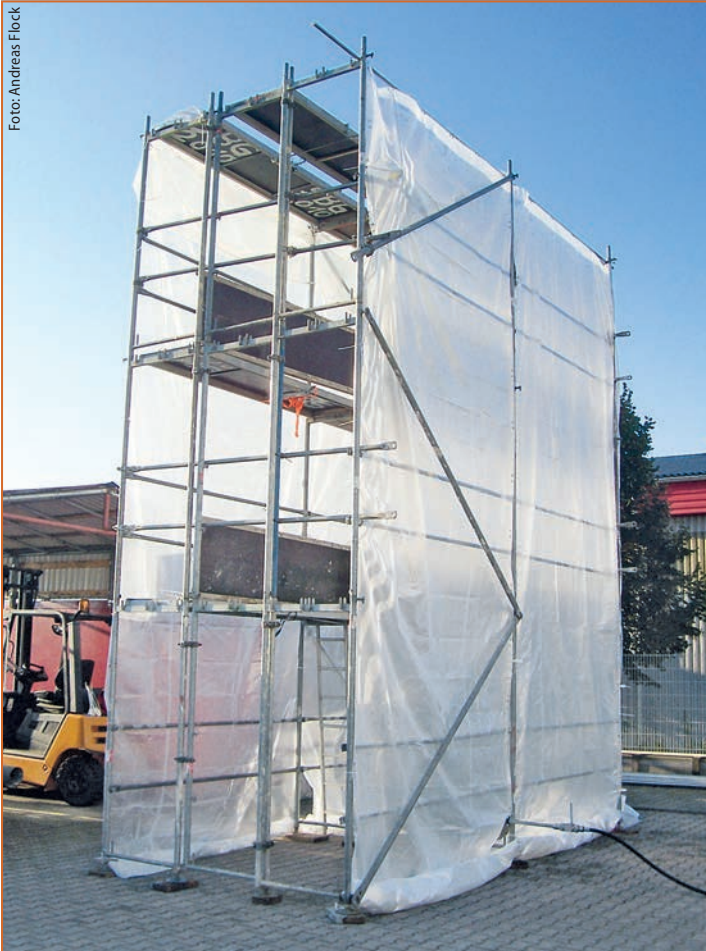
Abb. 5: Die Anlage zur Brandkontrolle, Gerüstaufbau für Vorversuche

motorisch betriebene und automatisch freigegebene Fassadenöffnungen in den Giebelwänden ein, während die Abströmung über Öffnungen im Dach erfolgt. Deren Wirksamkeit wird durch zusätzliche Nebeldüsen ergänzt; eine Unterstützung der Abströmung durch einen Ventilator kommt nicht zur Anwendung.