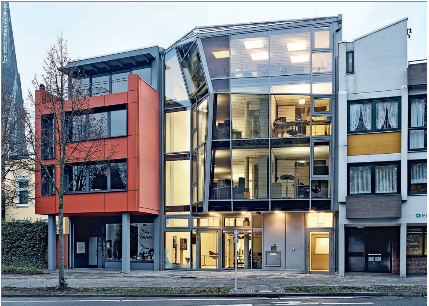
Abb. 1: Das Schlaue Haus in Oldenburg, Westfassade am Schlosswall

Brandschutzkonzept: Das Schlaue Haus in Oldenburg ist eine lichtdurchflutete Kombination aus der erhaltenen Substanz des wahrscheinlich ältesten Oldenburger Bürgerhauses und seiner modernen Erweiterung durch Behnisch Architekten, Stuttgart. Andreas Flock